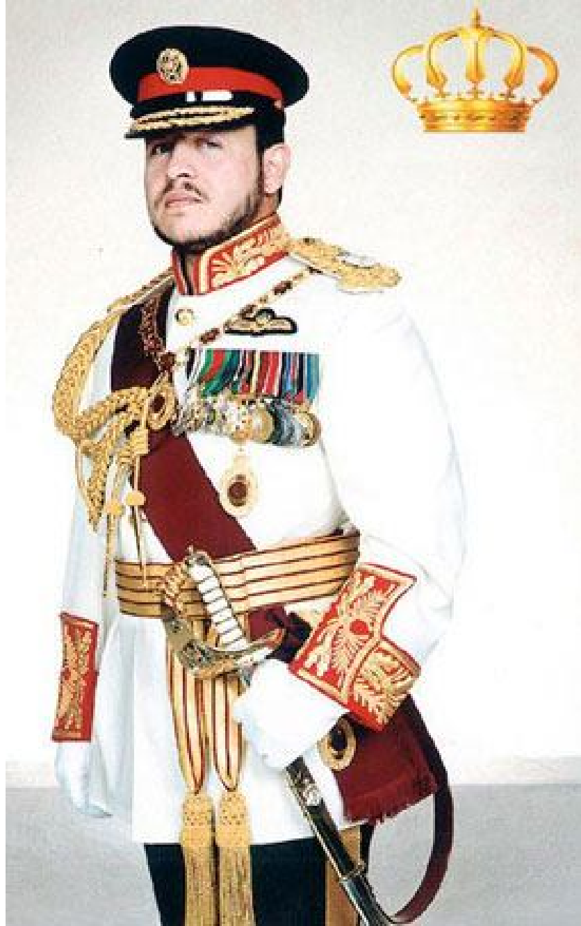
حضرة صاحب الجلالة الملك عبدالله الثاني بن الحسين المعظم